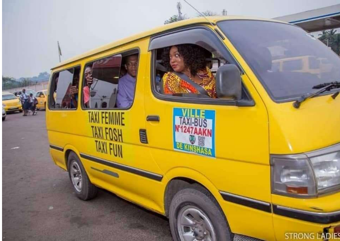
Photo taxi KETCH et taxi-bus Hiace