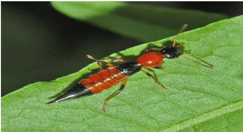
Coléoptère du genre Paederus (EKONDA / Cara-cara)