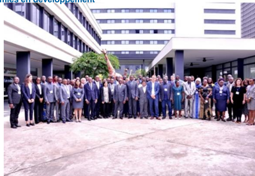
Atelier sur le climat au Nigeria, en collaboration avec AFRITAC West