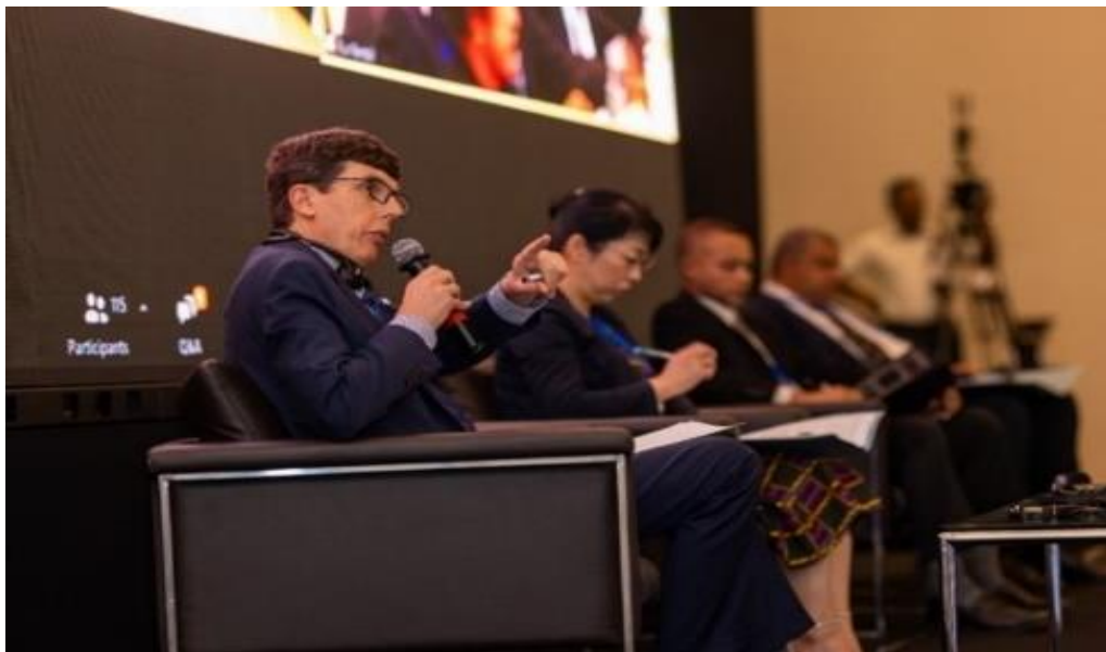
Conférence à l'occasion du 10e anniversaire - Panel : Priorités et défis de DC en Afrique subsaharienne