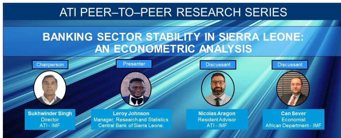
Séminaire de recherche entre pairs sur la stabilité du secteur bancaire en Sierra Leone IMF | Institute for Capacity Development