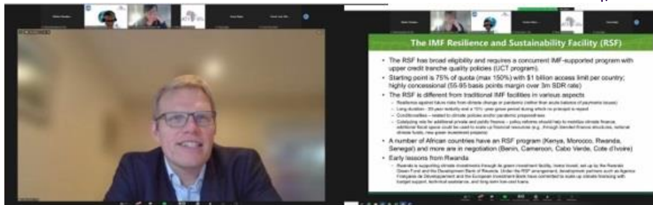
Premier webinar de la série sur le climat consacré aux politiques du secteur financier visant à débloquer le financement privé de la lutte contre le changement climatique dans les marchés émergents et les économies en développement